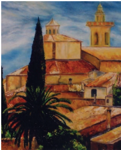
Magdalena Graf Vital und gegenständlich